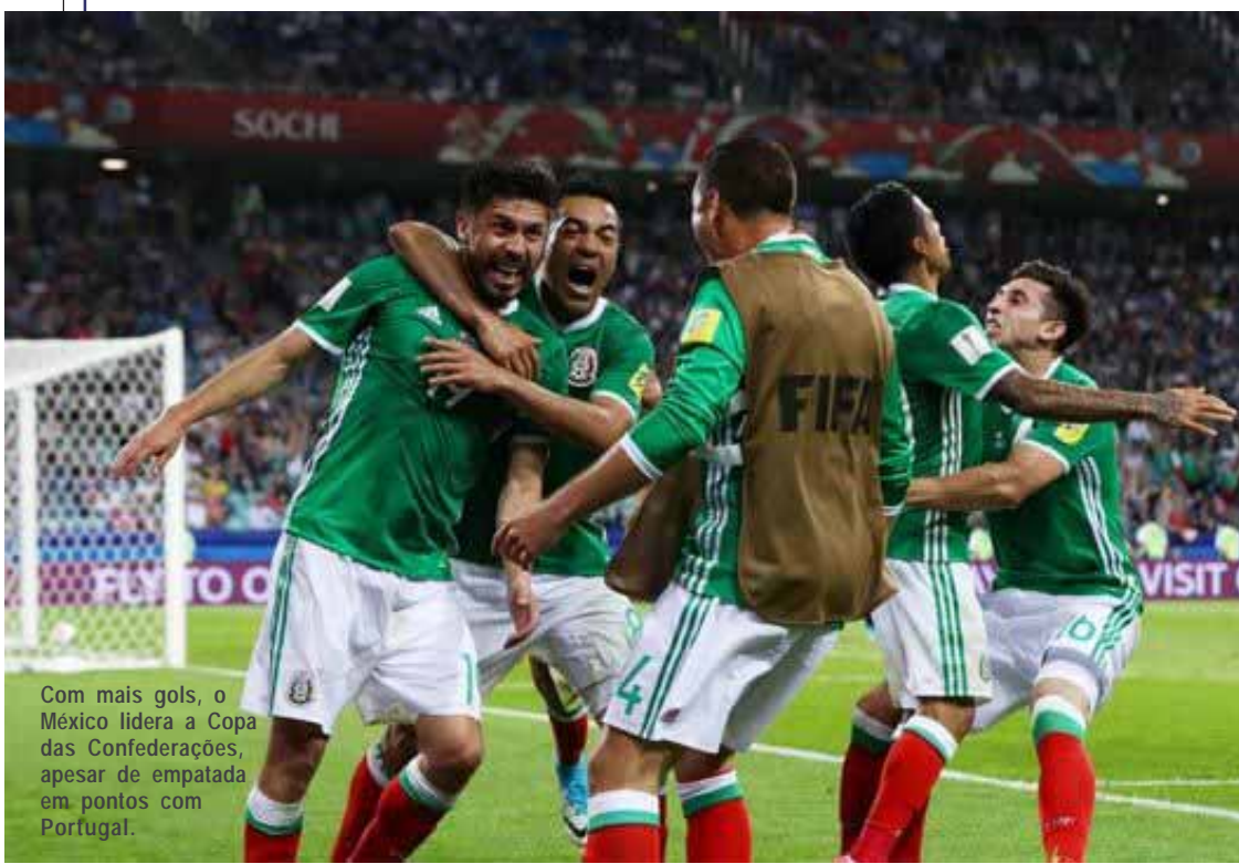
Com mais gols, o México lidera a Copa das Confederações, apesar de empatada em pontos com Portugal.

LOTÉRIAS: http://loterias.caixa.gov.br/wps/portal/loterias