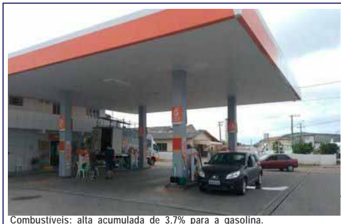
Combustíveis: alta acumulada de 3,7% para a gasolina.

De acordo com dados das Contas Regionais do IBGE, divulgados ontem, o PIB caiu em 2015 em todos os Estados