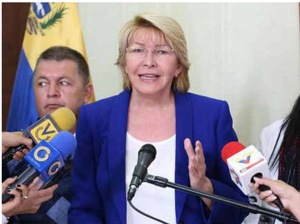
Luisa Ortega Díaz: arquivo com mil evidências de crimes do governo venezuelano de Nicolás Maduro.

EM GAFFE, PENTÁGONO COMPARTILHA TUÍTE PEDINDO RENÚNCIA DE TRUMP.