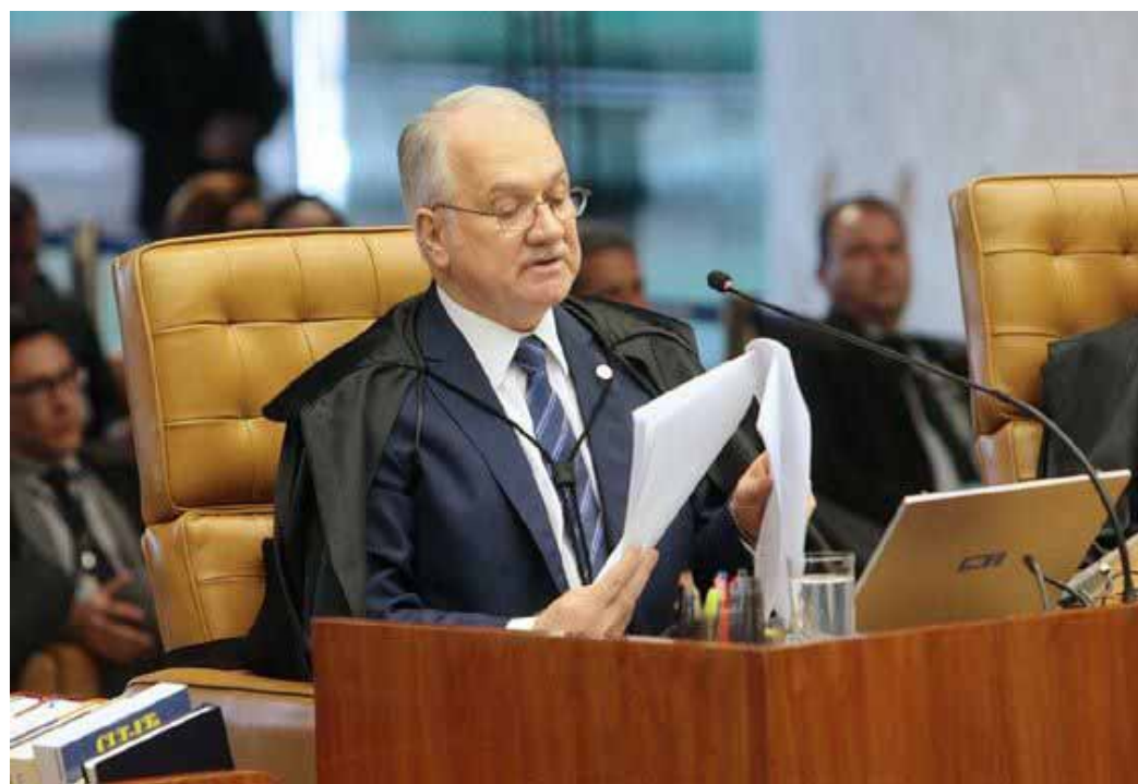
Ministro Fachin: pela homologação monocrática e pela sua própria manutenção na relatoria da Lava-Jato.

Pelo menos 10% dos eleitores terão de pedir recall do presidente