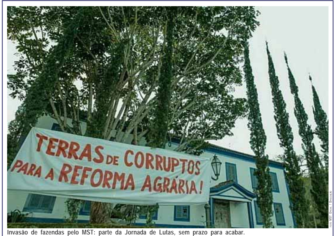
Invasão de fazendas pelo MST: parte da Jornada de Lutas, sem prazo para acabar.

“Temos uma parceria que não é de hoje”, disse ontem o governador Geraldo Alckmin (PSDB-SP) sobre o DEM. No dia anterior, Alckmin recebeu para jantar a cúpula do partido. Com isso, sinalizou uma possível aliança para a eleição presidencial de 2018. Até esse encontro, o governador dizia a aliados sua preocupação com a possibilidade do presidente da Câmara, Rodrigo Maia, suceder o presidente Michel Temer em uma eleição indireta e se tornar potencial concorrente. Hoje, Alckmin deve receber no Palácio dos Bandeirantes a cúpula do PSDB, oficialmente para discutir a atual conjuntura política.