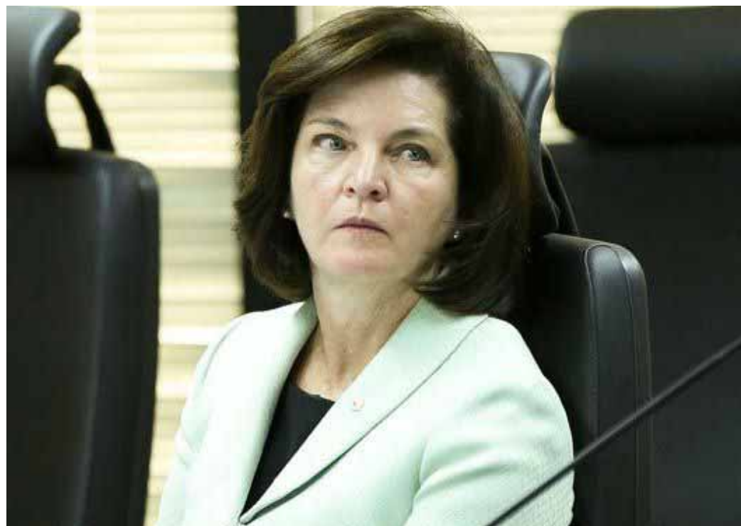
Procuradora-geral Raquel Dodge: prisão depois da segunda instância é fundamental contra a impunidade.

Por ter descumprido determinações do Supremo, o empresário Jacob Barata Filho, o “Rei do Ônibus” do Rio, teve prisão preventiva restabelecida, ontem. Barata Filho ha-