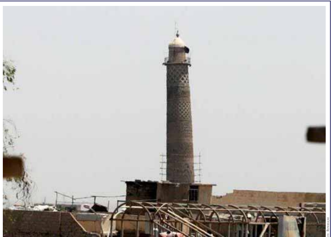
Minarete inclinado de Mossul: Estado Islâmico culpa a aviação dos EUA pela destruição.

REI DA ARÁBIA SAUDITA ANUNCIA FILHO COMO PRÍNCIPE HERDEIRO