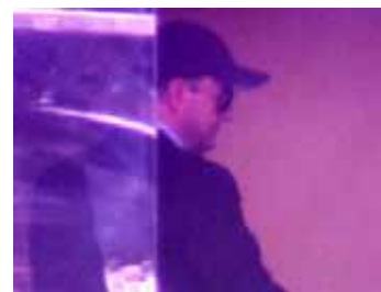
Imagem de TV