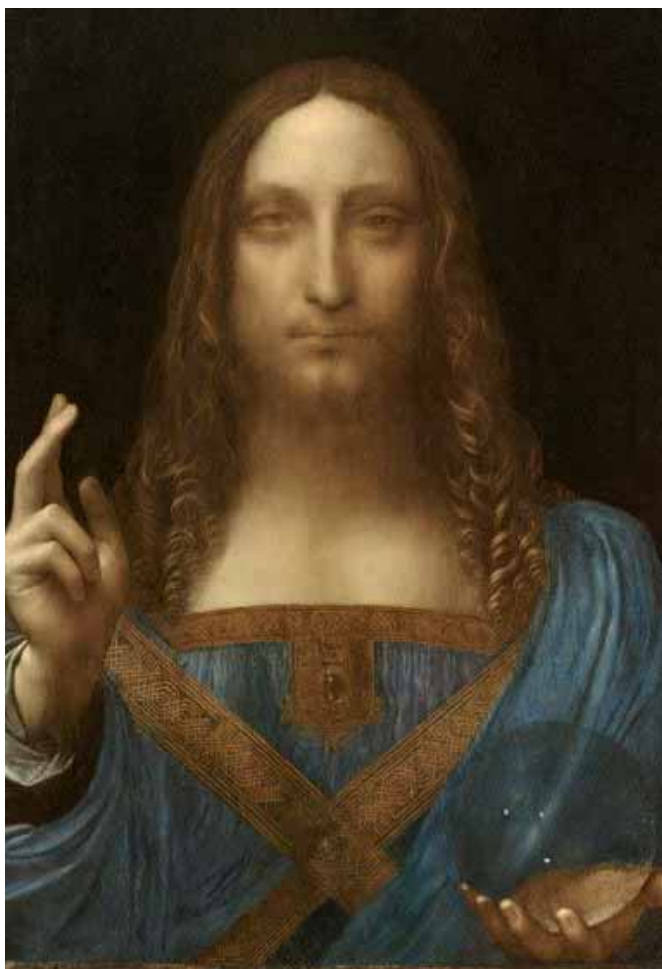
Salvator Mundi, c. 1500: maior redescoberta de Da Vinci.

LOTÉRIAS: http://loterias.caixa.gov.br/wps/portal/loterias