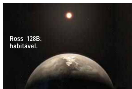
Ross 128B: habitável.