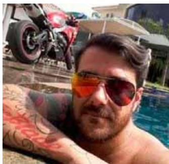
Filho da juíza: 130 kg de maconha.

preventivamente no PA e em SP. Os policiais também prenderam pessoas em flagrante, com arquivos no computador ou compartilhando o material. A polícia identificou os criminosos em um site russo, tido como um ponto de encontro de pedófilos no mundo todo.